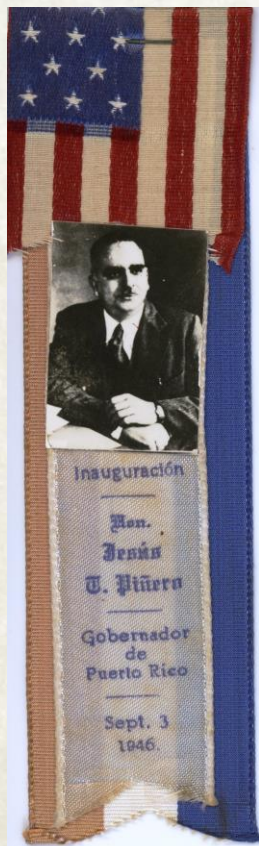
Recordatorio de la toma de posesión de Jesús T. Piñero como gobernador de Puerto Rico