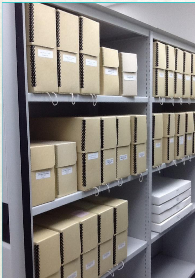
Parte de la colección documental